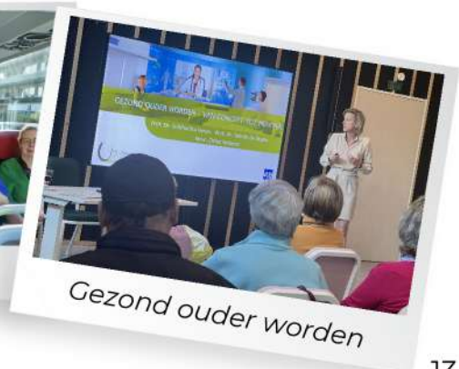
Gezond ouder worden